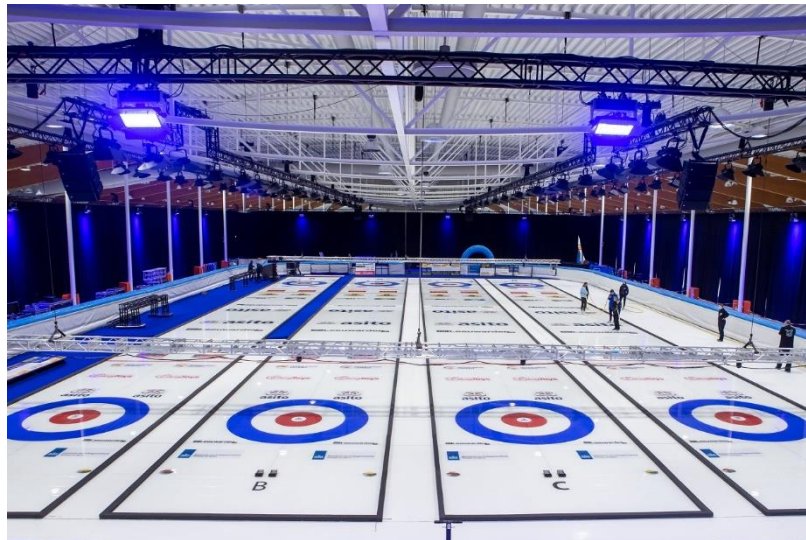
オリンピック最終予選時のカーリングの競技会場

男子／女子／ミックスダブルスとも1グループの総当たりの予選を行い、その上位4チームによる決勝トーナメントを行う。参加チームはいずれも10チームで、決勝トーナメントは予選1位と4位、2位と3位が対戦する準決勝とそれぞれの勝者が対戦する決勝、敗者が対戦する3位決定戦からなる。競技規則は通常の国際大会において適用されるものに準じており、オリンピック独自に適用される規則はない。