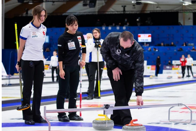
計測の様子

と氷上で作戦を協議するための時間であるタイムアウトが 1 回与えられる。タイムアウトをどのように有効に使うかも作戦の一つである。5 エンド（ミックスダブルスは 4 エンド）終了時には 5 分間の休憩（ハーフタイム）、それ以外のエンド間には 1 分間の休憩が与えられる。得点差が算術的に覆すことが不可能な場合、もしくは可能であっても双方の実力を考慮すると覆すことが困難な場合には、試合の途中で相手の勝ちを認め試合を終了（コンシード）することがある。